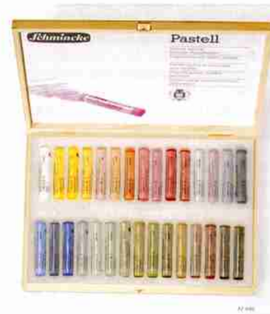
Art.-Nr. 77 030 Pastell Mehrzweck-Kasten