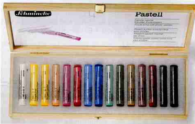
Art.-Nr. 77 115 Mehrzweck-Kasten

Pastelle sind auch heute aufgrund ihrer vielfältigen Anwendungsmöglichkeiten, der typischen satten Oberflächenwirkung und der zahlreichen Nuancen eine wichtige Farbe für viele Maler.