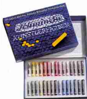
Art.-Nr. 77 830 Pastell Karton 30 Stifte Mehrzweck