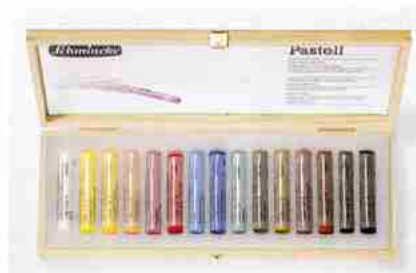
Art.-Nr. 77 115 Pastell Heller Holzkasten 15 Stifte Mehrzweck