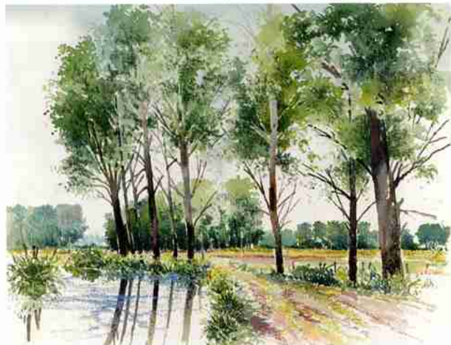
„Am Niederrhein“ auf „Arches grain fin“-Aquarellpapier

Das Motiv wird mit HORADAM® AQUARELL von Schmincke in trockener Manier gemalt.