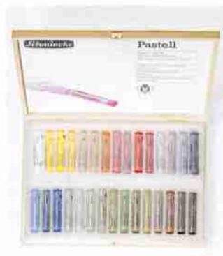
Art.-Nr. 77 030 Pastell Heller Holzkasten 30 Stifte Mehrzweck