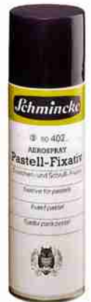
Art.-Nr. 50402 AEROSPRAY Pastell Fixativ