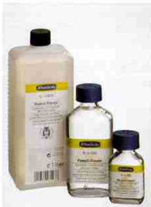
Art.-Nr. 50 068 Pastell-Fixativ (Flasche mit 60 ml, 200 ml oder 1000 ml)

Pastellbilder bleiben hochempfindlich und sollten unbedingt – allerdings sparsam – mit Fixativ überzogen werden. Hierzu bieten sich verschiedene Möglichkeiten an.