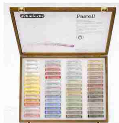
Art.-Nr. 77 060 Pastell Edler Holzkasten, nußbaum-gebeizt 60 Stifte Mehrzweck

Wir möchten Sie nach der Lektüre dieser Broschüre anregen, sich auch mit Hilfe qualifizierter Kurse weiterzubilden und neue Techniken zu erlernen, denn je sicherer man wird, desto größer ist auch die Freude am Malen. Vielleicht dürfen wir Sie demnächst in einer der jeden Sommer stattfindenden Schmincke-Malwochen begrüßen. In kleinen Lerngruppen unter der Leitung erfahrener Dozenten, die alle ausübende Künstler sind, werden in kompakten Wochen-, aber auch in Schnupperkursen die verschiedensten Maltechniken und Themenstellungen erarbeitet. Weitere Informationen und einen Malwochenprospekt senden wir Ihnen gerne zu.