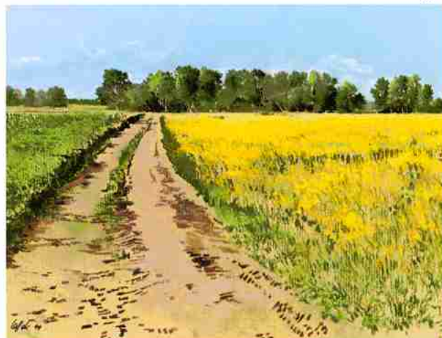
„Rapsblüte“ auf blaßgelbem Ingres-Passepartoutkarton

1. HORADAM® GOUACHE: Der Himmel wurde mit einer Titanweiß-Helloblau-Mischung mit einer wolkenartigen Weißaufhellung am Horizont angelegt.